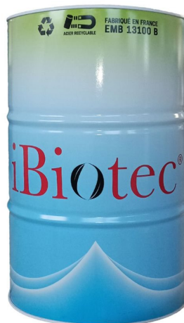
Barel s objemom 200 L