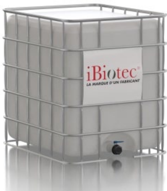
Kontajner GRV s objemom 1000 L